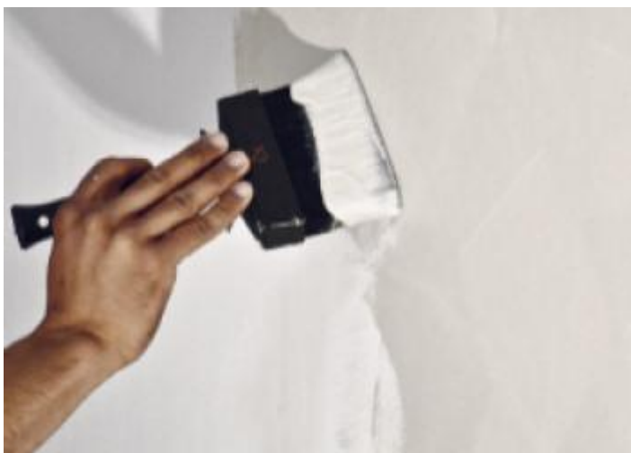
Étape 4 - Première Couche.